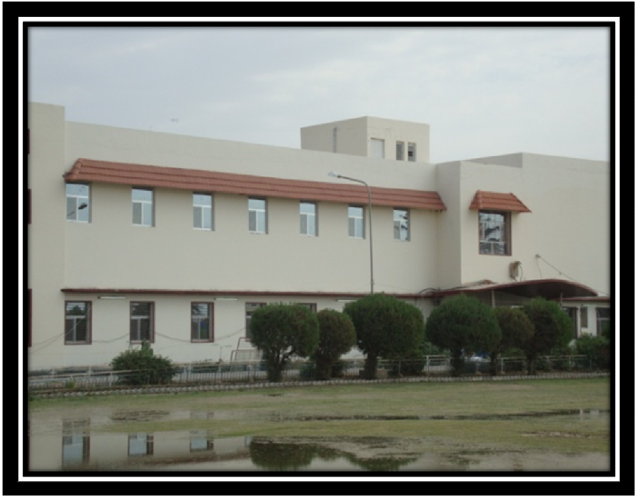
عمادة كلية الزراعة