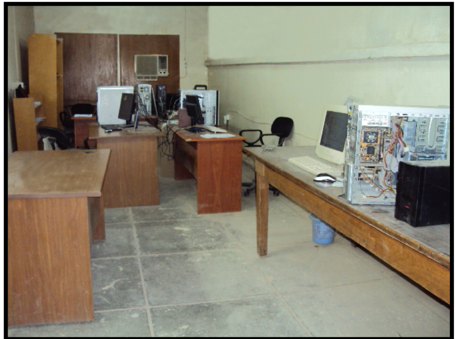
وحدة صيانة الحاسبات التابعة للشعبة