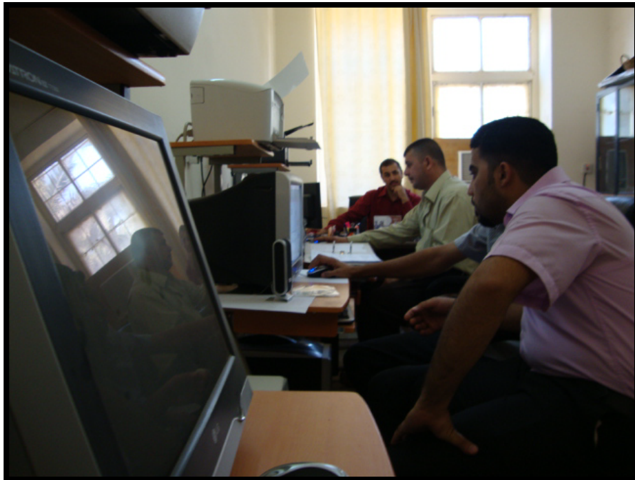
وحدة قاعدة البيانات