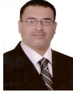
بقلم الدكتور علي درب الحيايالي

الضرائب المرتفعة فضلا عن تغيير أسعار الصرف في البلد المعني وأخيرا القيود التي تفرض على خروج الأموال من الدولة المستثمر