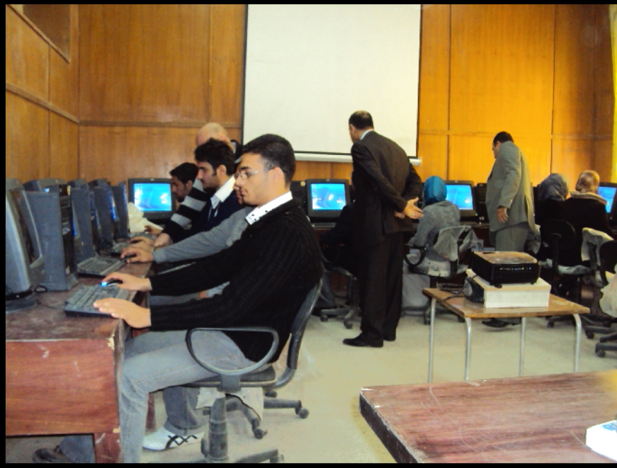
وحدة الانترنيت التابعة لشعبة الحاسبات

نحتاج الى زيادة التخصيص المالي وسلفة خاصة بالشعبة من اجل سهولة وسرعة تلبية احتياجات الشعبة. وكتمهيد للربط الالكتروني وتكوين ما يعرف بالحكومة الالكترونية المصغرة بدأت الشعبة بانشاء قاعة انترنيت تعليمية من اجل زيادة كفاءة الدارسين باستخدام هذا المجال الرائد للافادة من الابحاث العالمية وكذلك الاتصال بالجامعات والمتخصصين .